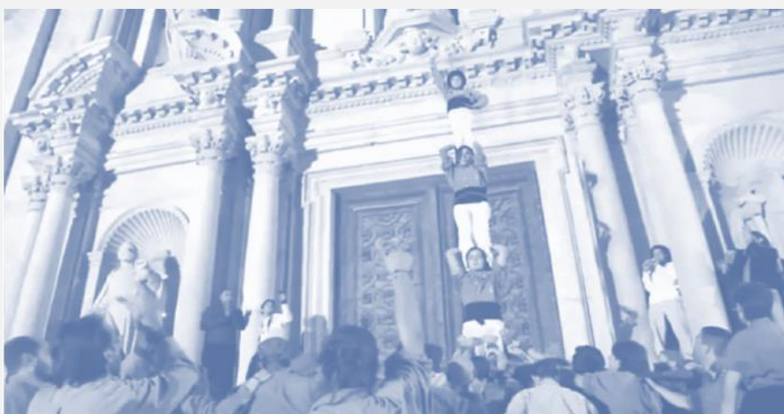
Lo llevamos dentro (Ho portem dins) ( ver video )

Descripción: compartir el video "Lo llevamos dentro". Este material nos invita a pensar acerca del valor del aprendizaje cooperativo y la motivación de una comunidad para lograr sus metas.